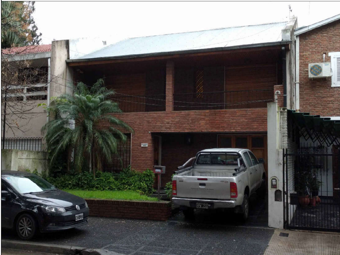
Fotografía 2, Contrafrente - Canaleta 1.2 y caños de bajada hasta Planta Alta.